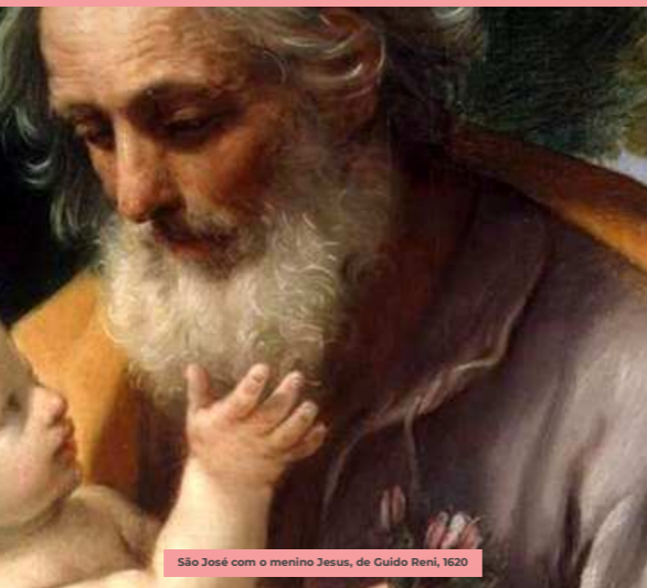
São José com o menino Jesus, de Guido Reni, 1620