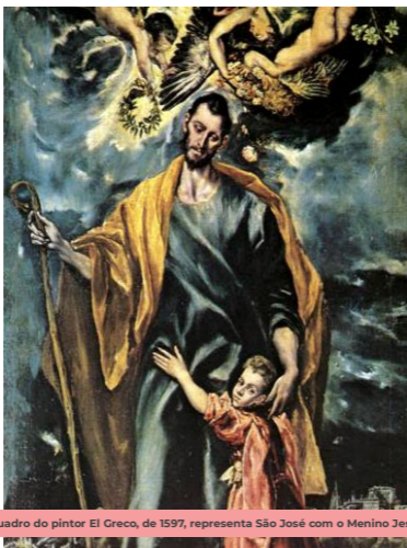
Quadro do pintor El Greco, de 1597, representa São José com o Menino Jesus

“ Todos podem encontrar em São José – o homem que passa despercebido, o homem da presença cotidiana discreta e escondida – um intercessor, um amparo e um guia nos momentos de dificuldade. São José lembra-nos que todos aqueles que estão, aparentemente, escondidos ou em segundo plano, têm um protagonismo sem paralelo na história da salvação. A todos eles, dirijo uma palavra de reconhecimento e gratidão”, completa Francisco.