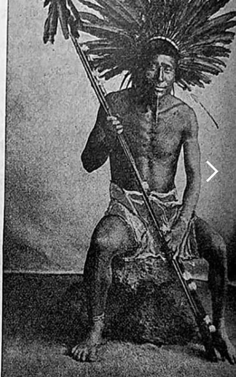
Um cacique da tribo dos Coroados (Brasil).

Essas matérias se concentravam inicialmente na presença salesiana na Patagônia argentina – primeiro destino missionário dos Salesianos de Dom Bosco na América – e entre os indígenas do Mato Grosso e do Alto Rio Negro – primeiras áreas missionárias no Brasil. Eram relatos extremamente detalhados de Salesianos e Filhas de Maria Auxiliadora nas missões, escritos de forma literária e, muitas vezes, acompanhados de fotos.